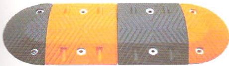
型号: CAS-LG-2 品名: 优质梯型减速坡 规格: 250×350×50mm 适用: 公路收费站、工业区、码头、花园小区