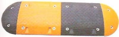
型号: CAS-LG-1 品名: 大圆弧减速坡 规格: 500×430×50mm/500×460×70mm 适用: 公路收费站、工业区、码头、花园小区